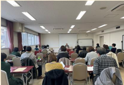
千葉市民会館にて定期総会の様子